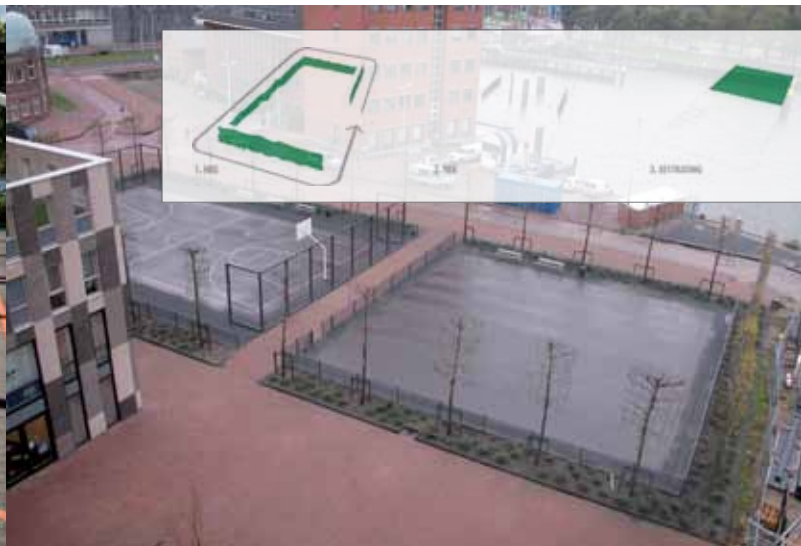
HERINRICHTING VAN HET SCHOOLPLEIN AAN DE MÜLLERPIER IN ROTTERDAM MET RECHTS DE OUDE SITUATIE.

ruimte belangrijk. Het belang daarvan wordt nog versterkt omdat het plein door de opkomst van kinderopvang, buitenschoolse opvang en brede school vaak niet meer alleen van 9 tot 3 uur gebruikt wordt, maar vaak van 8 tot 6 uur. Omdat het plein – mede door die ontwikkeling – wordt gebruikt door leeftijdsgroepen van 0-4, 4-6 en 6-12 jaar, is ook ruimtelijke differentiatie op leeftijd nodig. Tegelijkertijd moet er ook aandacht zijn voor veiligheid en toegankelijkheid .