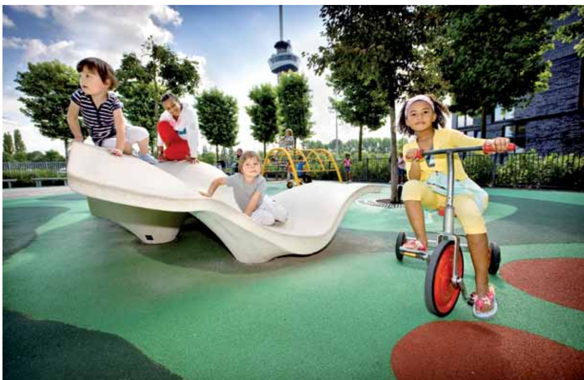
HET SCHOOLPLEIN OP DE MÜLLERPIER IS VOORZIEN VAN EEN SCHELP VAN ENRIC MIRALLES. EEN VERSTOP- EN ZITPLEK.